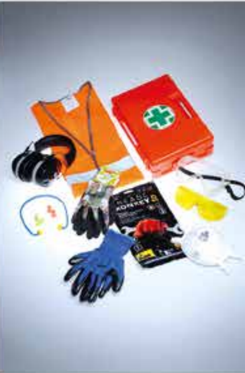
ÉQUIPEMENTS DE PROTECTION INDIVIDUELLE