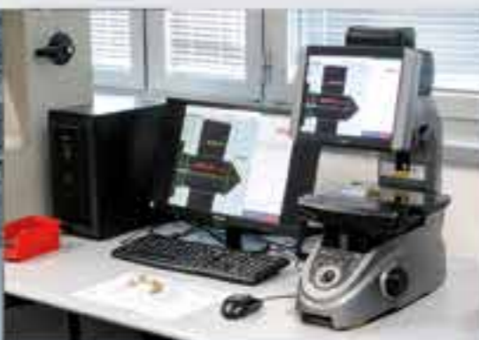
SÉLECTION OPTIQUE À 100%