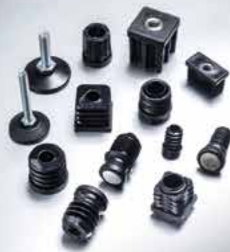
BOUCHONS, INSERTS ET PARE-CHOCS