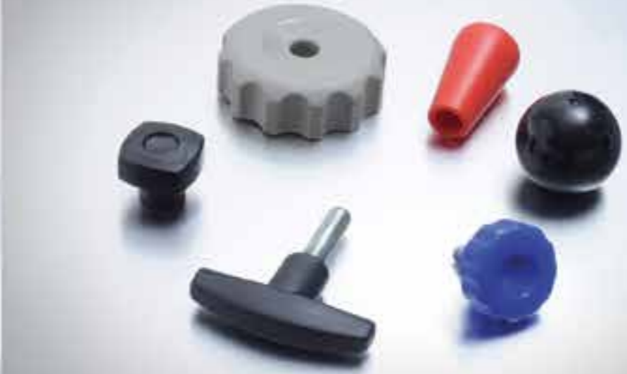
ÉLÉMENTS DE MANŒUVRE ET DE SERRAGE