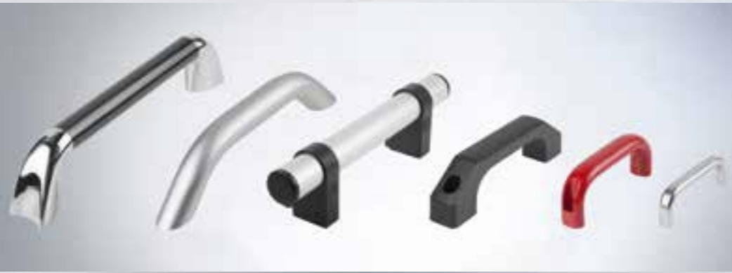
POIGNÉES ÉTRIER POIGNÉES TUBULAIRES POIGNÉES ENCASTRABLES