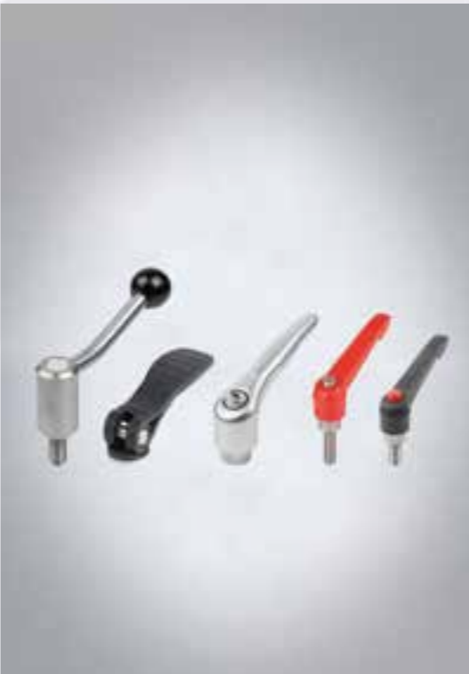
POIGNÉES À LEVIER LEVIERS DE BLOCAGE LEVIERS DE CAME