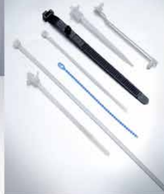
COLLIERS DE SERRAGE, LACETS ET SUPPORTS POUR CÂBLAGE