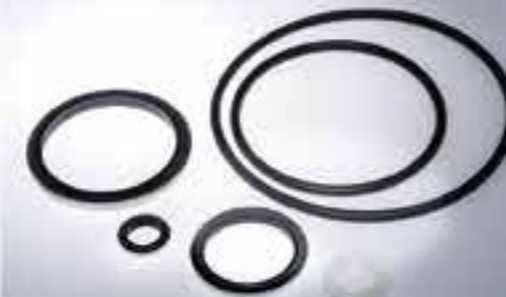
JOINTS TORIQUES COLLÉS