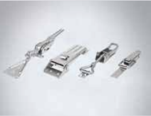
SERRURE À LEVIER