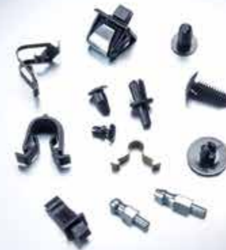
FERMETURES, RIVETS CLIPS ET ÉCROUS