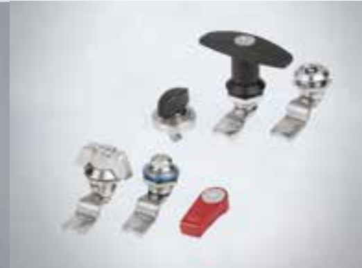
SERRURES À VERROU TOURNANT