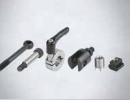
ÉLÉMENTS MÉCANIQUES COMPOSANTS POUR MACHINES ET ÉQUIPEMENTS